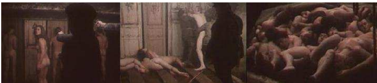
Рис 2. Кадры из фильма ужасов «Чекист» А. Рогожкина

внимающе иудейскимъ баснемъ, ...заповѣдемъ человекъ отвращающихся от истины (Тит 1.14); ...и бабіихъ басней (1 Тим 4.7); от истины слухъ отвратятъ, и къ баснемъ уклонятъ (2 Тим 4.4).