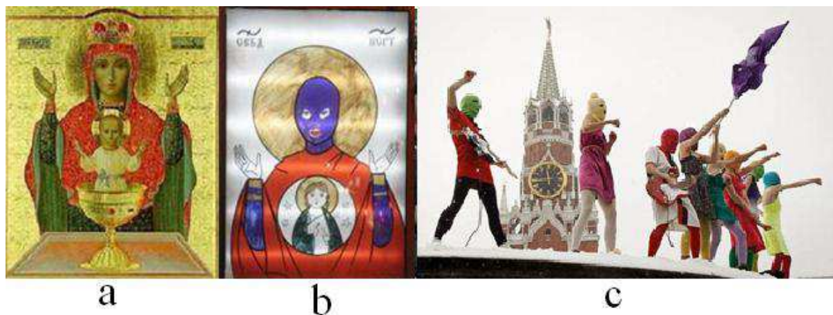
Рис 5. Икона «Неупиваемая чаша» (а) [1], инверсный вариант Премудрости Божией (б) [10] и матриархат восстал (с) [IX].

Дети-дьявола в рясах и без, предчувствуя грядущий капец, за правду распяли Pussy Riot на тюремных решетках: Христови сраспяхся (Гал 2.19).