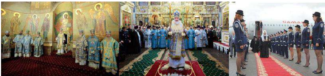
Рис 4. «Красиво жить не запретишь» – народная мудрость

формировать человека-творца, а сейчас задача заключается в том, чтобы взрастить квалифицированного потребителя» [VI]. Для этого в школы внедрили психотехнику тотальной дебилизации учеников (ЕГЭ), отпрофилировали программы, ввели религиоведение (ОПК) и запустили «золотого козла».