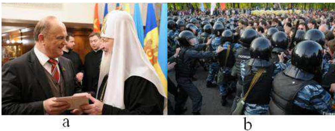
Рис 3. Предстоятели КПРФ и РПЦ – (а); аггелы антихриста – (b)

Поэтому дети-дьявола безбоязненно заменили после распада СССР дискредитированную ими же коммунистическую идеологию на идеологию Московского патриархата (Рис 3а), во главе угла которой был уже не Христос, а золотой телец (Рис 4): сотвориша себѣ бѣги златы (Исх 32.31); Растлѣша и омерзишася въ начинаніихъ: нѣсть творяй благостыню (Пс 13.1); очи имуще исполнь блудодѣянія и непрестаемаго грѣха, прельщающе дѹшы неутверждены, сердце научено лихоимству имуще... оставльше правый путь (2 Петр 2.14,15).