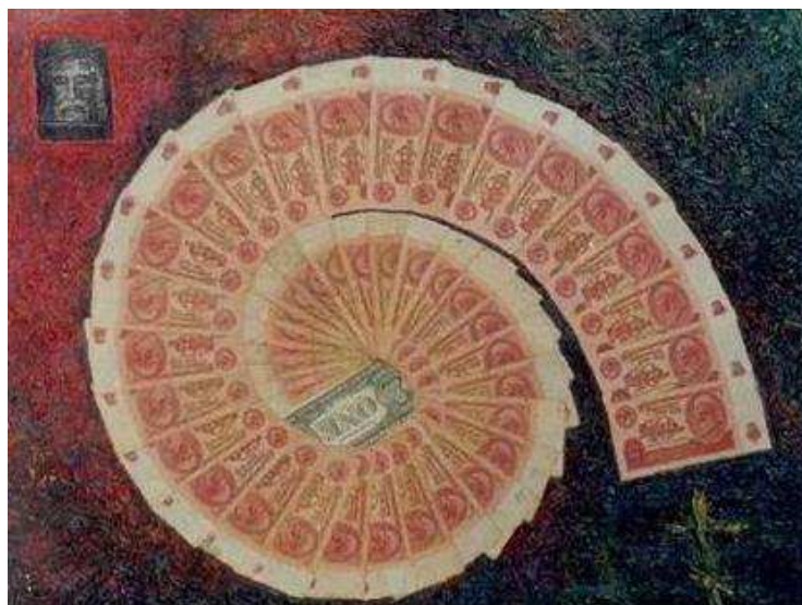
Рис 2. Вихрь духовного беззакония

С такими «целителями» и их жертвами пророк Александр встречался неоднократно и ненормальность их психофизики легко обнаруживал. Например, один из них, отчитывая коллег Александра по работе, предлагал и ему пройти его оккультную обработку. После недолгого разговора Александр выяснил, что «целитель» трижды клинически умирал и в голове у него беспорядочная мешанина из христианских и буддийских понятий. Дозволив экстрасенсу положить руку на свою лысину, Александр «включил» в уме молитву Воина Духа [3]. Буквально через 20-30 секунд экстрасенс, испуганно отдернув свою руку: «Она греется!», - добавил, что у него в голове все перевернулось, и возобладал смысл, сказанный ему ранее Александром. После этого он стал уговаривать Александра наложить на него свою руку и отчитать, чего, конечно, Александр делать не стал.