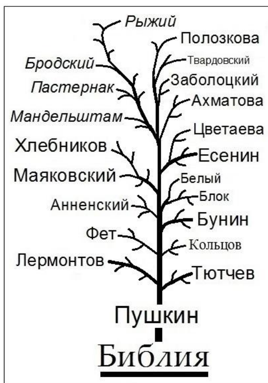
Рис 1. Генеалогическое древо русской духовной (умной) поэзии.

Левые ветви дерева представляют поэтов, в творчестве которых преобладает логика духовного синтеза (Тютчев, Бунин, Есенин и др.) [6]. Правые ветви после Хлебникова – русскоязычные поэты, в мышлении которых начинает доминировать словесная эквилибристика, построенная на смысловых инверсиях и извращениях (Мандельштам, Пастернак, Бродский и др.). Курсивом условно отмечены поэты, в творчестве которых ветхозаветная духовность превалировала над новозаветной [1].