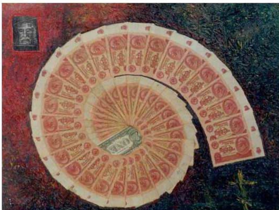
Рис 1. Схема вихря духовной смуты конца XX века.

Эволюция человека, подчиняясь диалектическому закону единства и борьбы противоположностей (ОПД) [1] проявляется во времени двойной спиралью исторических реалий, которые по сути своей как бы взаимоисключают друг друга: мир и война, созидание и разрушение, наука и шарлатанство, откровения и мистификации, вера и изуверство: вся дела Вышняго: двое, двое, едино противу единого (Сир 33, 14) . Надломы, скачки и метания этой спирали отнюдь не случайны – любому событию в нем предшествует то или иное изменение вектора космической энергетике, разящим острием которого является Солнце [2, 3]. Этот вектор и есть тот алмазный резец, коим вещественный образ Бога - человек - доводится до совершенства: творити по всему делу премудрости (Исх 35, 33); воли бо Его кто противитися может? (Рим 9, 19) .