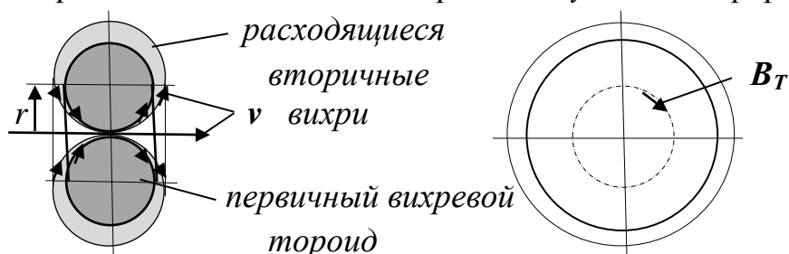
Рис. 1. Эфирный тороидальный микровихрь с двумя равными радиусами вращения (слева его поперечное сечение); B_T – псевдовектор торовой магнитной индукции по кольцевой оси вихря.

Эфирные вихри на фундаментальном уровне движения отличаются от наблюдаемого простого вращения в жидкости или в газе. Такой элементарный эфирный вихрь в виде тороида со своим торовым вращением и есть элементарное возбуждение эфира, рис. 1.