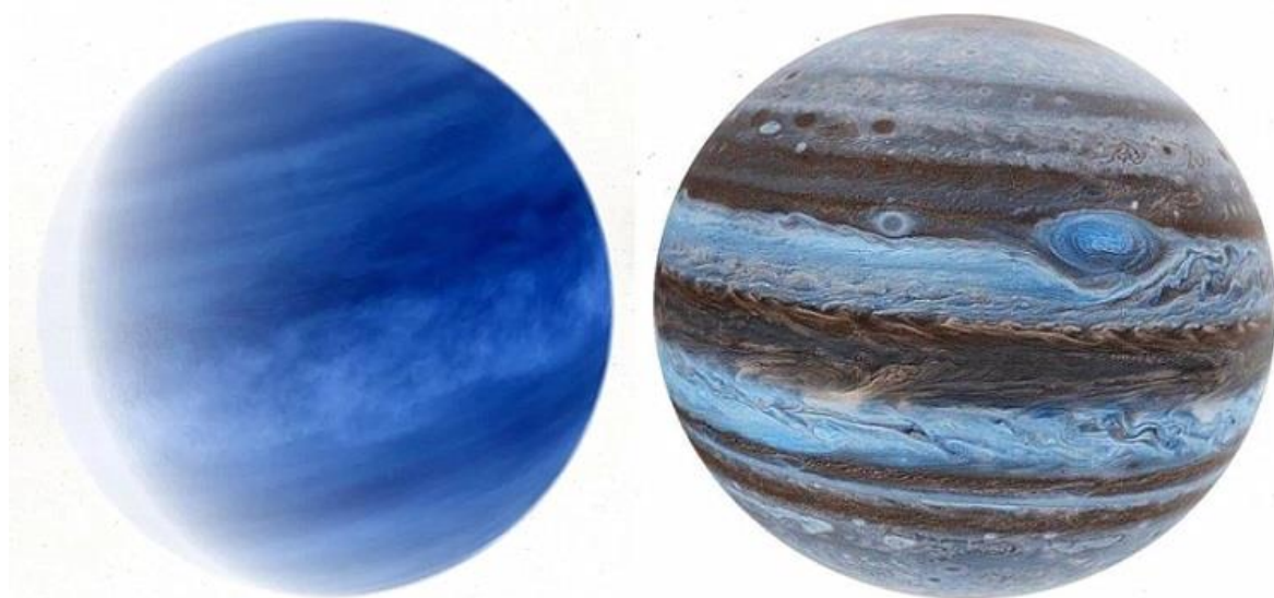
Рис.3 Широтные пояса на Венере и Юпитере.

Что касается других, доступных для изучения проявлений волновых свойств гравитации, то каждое из них требует на данном этапе масштабной и систематической работы по сбору данных. Такие наблюдения и сбор данных требуют также разработки новых методик, ориентирующихся на проявления эффекта давления электромагнитных волн и исключение сопутствующих факторов. Например, в случае с морскими приливами и отливами изучение гравитационных волн усложняется из-за влияния устоявшихся течений и сил инерции водных масс, возникающих при вращении Земли, прецессии оси вращения и неравномерности ее орбитальной скорости. В попытке исключить или уменьшить влияние этих приповерхностных факторов, можно предложить ежедневный мониторинг давления на значительных морских глубинах. В этом случае приповерхностные флуктуации давления будут демпфированы значительной массой воды. Одним из ожидаемых результатов такого эксперимента может быть фиксация синхронных изменений гравитационного давления и его периодичности в разных точках наблюдения. Комплексное изучение массива полученных данных, собранных из различных точек, может дать весомый вклад в науку о земной гравитации. Аналогичный подход необходимо применить и к известным гравитационным аномалиям на поверхности Земли.